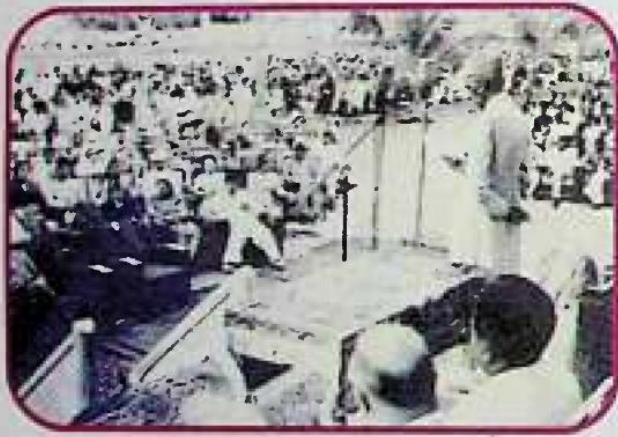
قائد اعظمؒ کا طلبہ سے خطاب

”وہ کون سا رشتہ ہے جس سے منسلک ہونے سے تمام مسلمان جسد واحد کی طرح ہیں؟ وہ کون سی چٹان ہے جس پر اس ملت کی عمارت استوار ہے؟ وہ کون سا لنگر ہے جس سے اس امت کی کشتی محفوظ کر دی گئی ہے؟ وہ رشتہ، وہ چٹان، وہ لنگر خدا تعالیٰ کی کتاب قرآن مجید ہے۔“